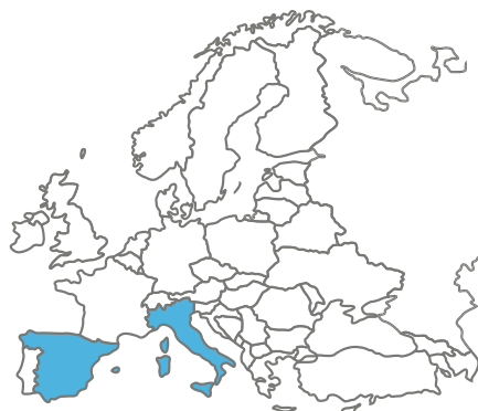
Instituto Europeo San Francisco (EISAF) sede España e Italia

Asimismo, la ONG CEDA, a través de la Embajada Argentina en Washington (Estados Unidos), se encuentra en avanzado estado de negociaciones. Toda la información actualizada de las sedes se encuentra en la web del CELU . ■